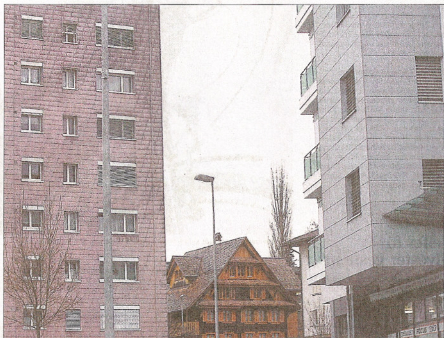
Steinhausen: Vom einstigen Bauerndörfchen ist kaum mehr etwas übrig geblieben.